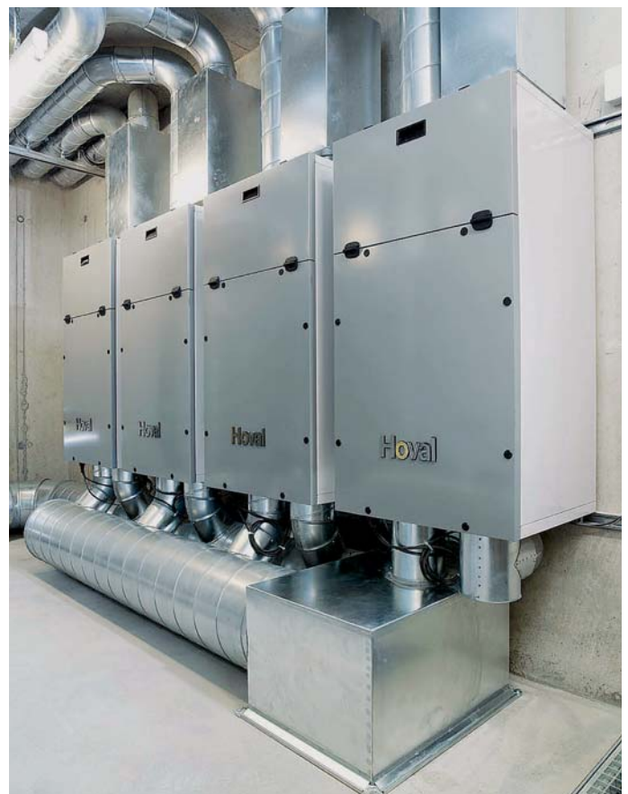
In Neftenbach, Kanton Zürich (CH), in der Überbauung „Wolfzangen“, sind diese Geräte installiert. Sie waren bereits mehrfach Gegenstand von Fachartikeln und haben wesentlich dazu beigetragen, dass kontrollierte Wohnraumlüftung immer mehr Anklang findet.

Nicht nur allein die Anschaffungskosten können dadurch so gering wie möglich gehalten werden, sondern auch die Betriebskosten. Durch die Kältespeicherung des Enthalpietauschers wird das Split-Klimagerät entlastet und sein Stromverbrauch gesenkt.